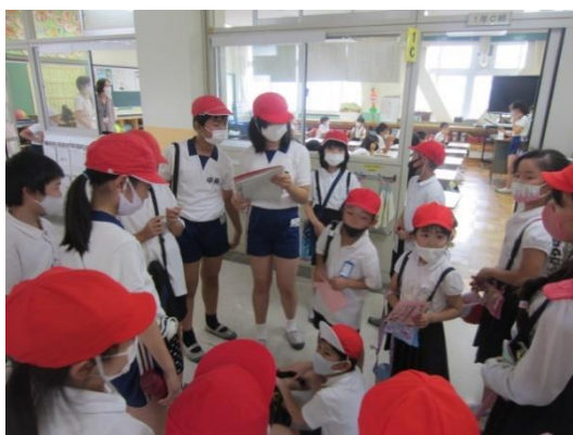
写真 3. たてわり遊び：高学年が進めていく

文科省による小学生の頃の「体験活動」についての調査研究結果が出ている。遊び相手などによる影響を分析したところ、異