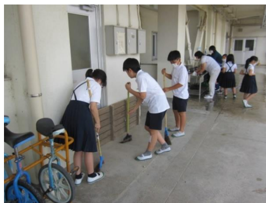
写真2 . 3 つの約束 : しっかり「そうじ」

その人の方を向いて頷いたり笑顔を返したりすることを含め、よく聴くことは相手を大切にすることである。自分の主張より、まず人の話を聴くことを大切にすること。話をきちんと聴くことは一人一人が大事にされる社会をつくることにつながる。