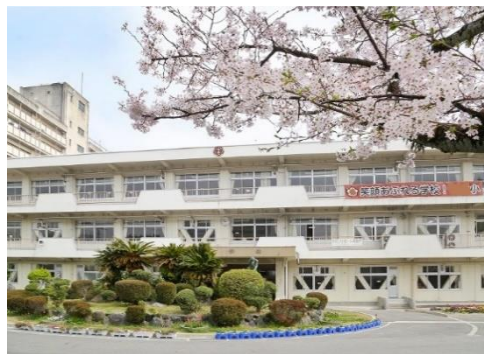
写真1 . 笑顔あふれる学校! 横断幕

自分だけではなく、自分のいる集団のために役に立とうとする意欲と力のある人を育てていきたい、ルールだけでなく、思いやりで自分の行動を決められる人、目には見えないけれど大切なことを理解できる人に育ててほしいと願っての横断幕である。C 小学校のキャッチフレーズとなっている。